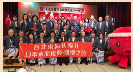
おくとばす君登場！