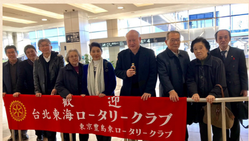
歓迎！台湾・東海ロータリークラブ