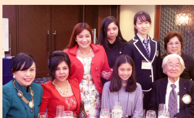
山元会員ご一家と涌井会員ご一家・ご友人