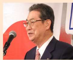
前川PGより乾杯の挨拶