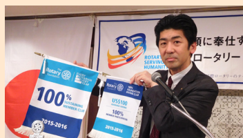
「Every Rotarian, Every Year」と「100%ロータリー財団寄付クラブ」表彰のフラグ