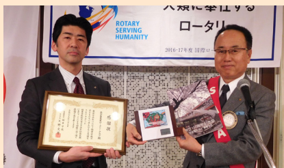
創立130周年を迎えた錦華学院より感謝状