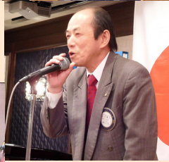
月井副会長より閉会の挨拶