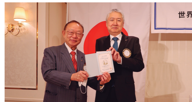
宮代会員 (第13回メジャードナー)