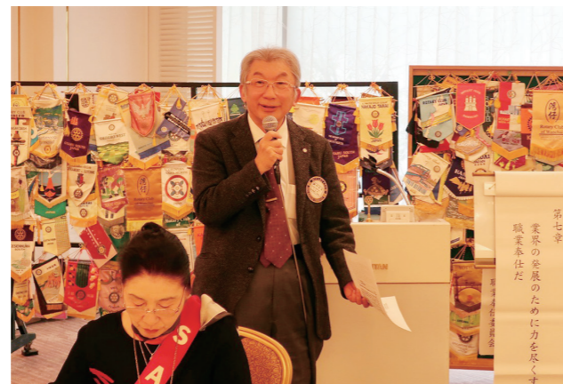
廣内職業奉仕委員会委員長