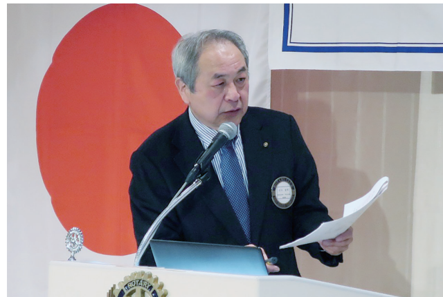
石川地区職業奉仕委員会委員