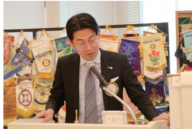
2023-24年度 国際ロータリーのテーマ