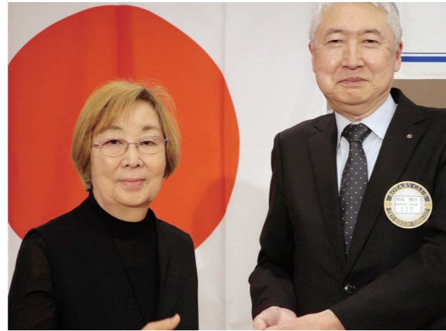
4月お誕生日 細田会員